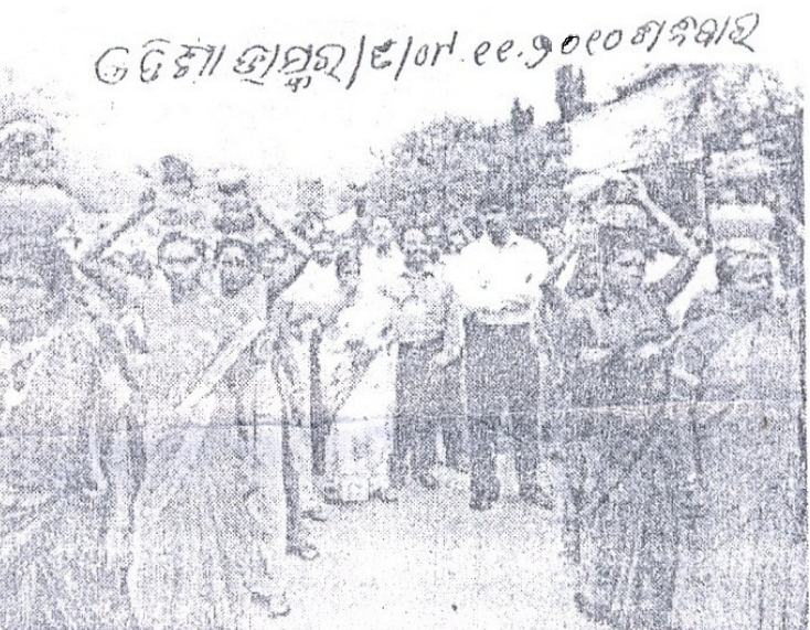
ଓଡ଼ିଶା ଉତ୍କଳ/୧/୦୧/୧୧.୨୦୧୦ ଶିବିର